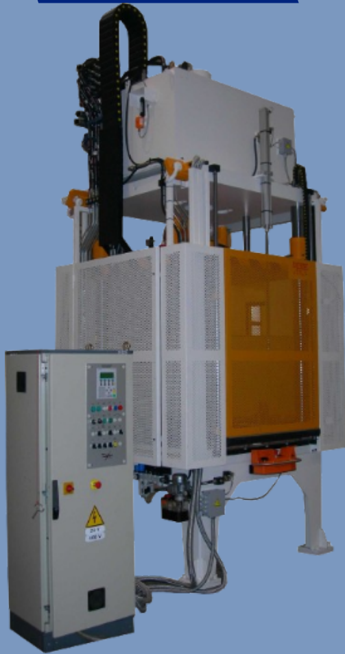
DS PT 55 S