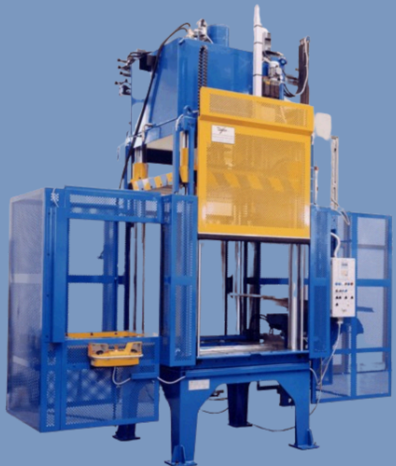
DS PT 55 SL